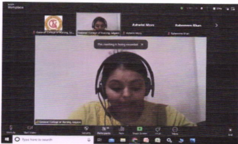
Fig - 4