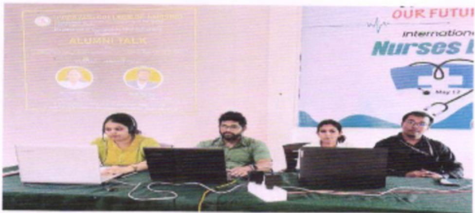
Fig - 2 Organizing Members