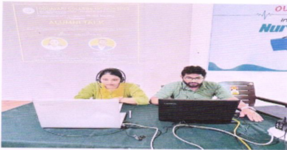
Fig - 1

21TH MAY 2024. ALUMNI TALK ON THE FUTURE OF COMMUNITY HEALTH NURSING: TRENDS, OPPORTUNITIES AND THREATS.